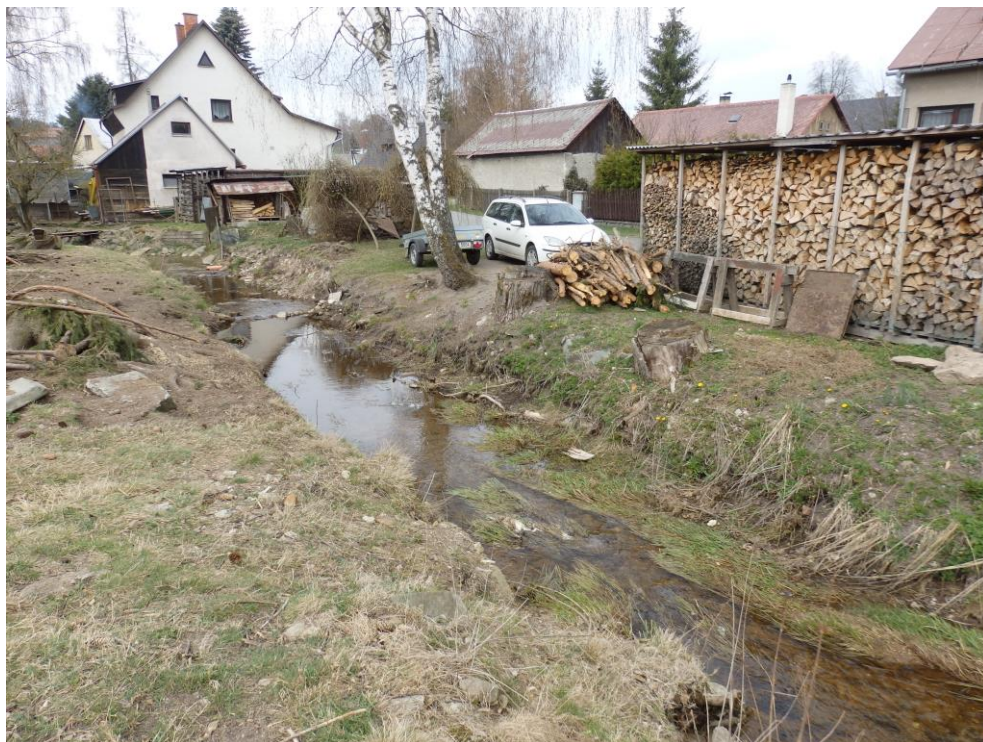
Obr. 9. – nelegální skladování dřeva z protějšího břehu