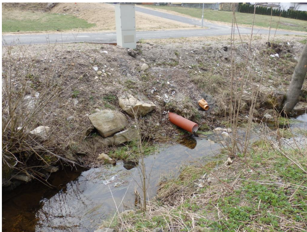
Obr. 20. – stávající vyústění potrubí – navrženo k opevnění záhozem z LK