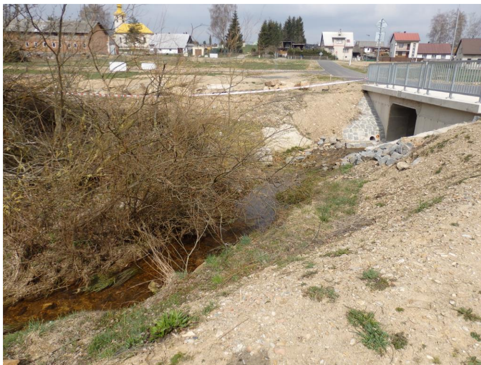
Obr. 16. – stávající stav koryta pod nově vybudovaným mostkem