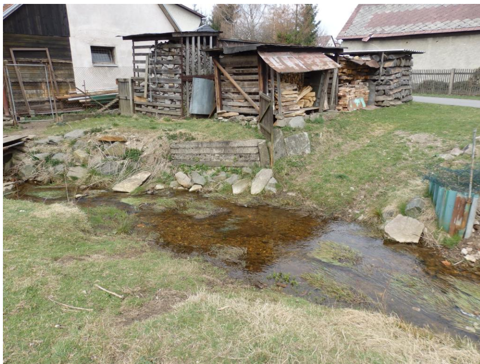
Obr. 8. – nelegální skladování dřeva v blízkosti toku na obecních pozemcích