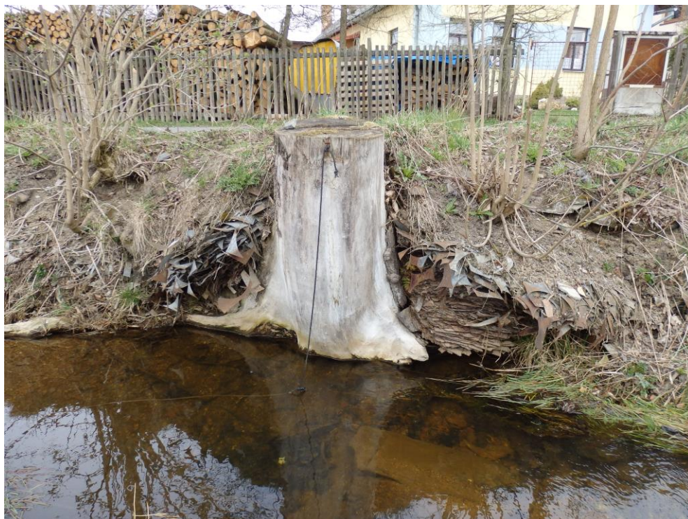
Obr. 11. – stávající stav pravého břehu vytvořený z násypu sutě a odpadu