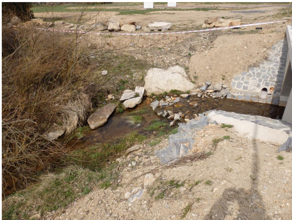
Obr. 17. – stávající stav koryta pod novým mostkem – pravoúhlé napojení na koryto