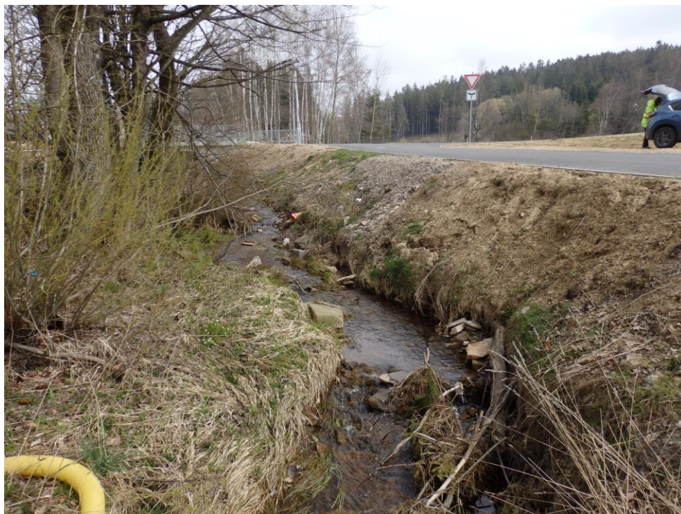
Obr. 13. – kritické místo namáhaného nově vytvořeného svahu koryta