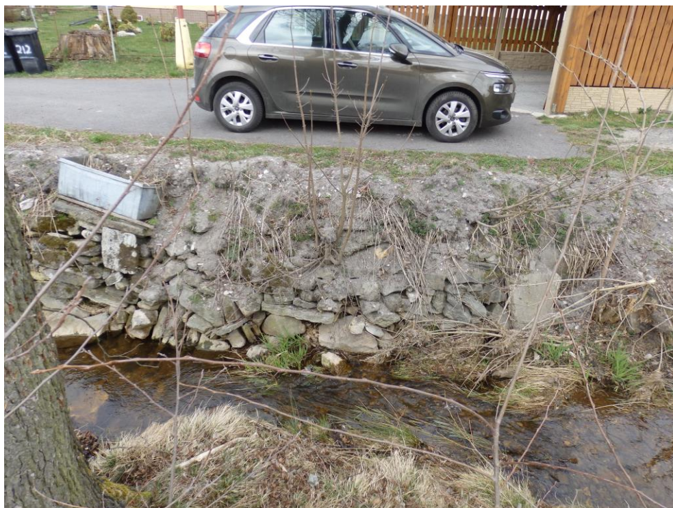
Obr. 10. – stávající stav pravého břehu vytvořený z násypu sutě a odpadu