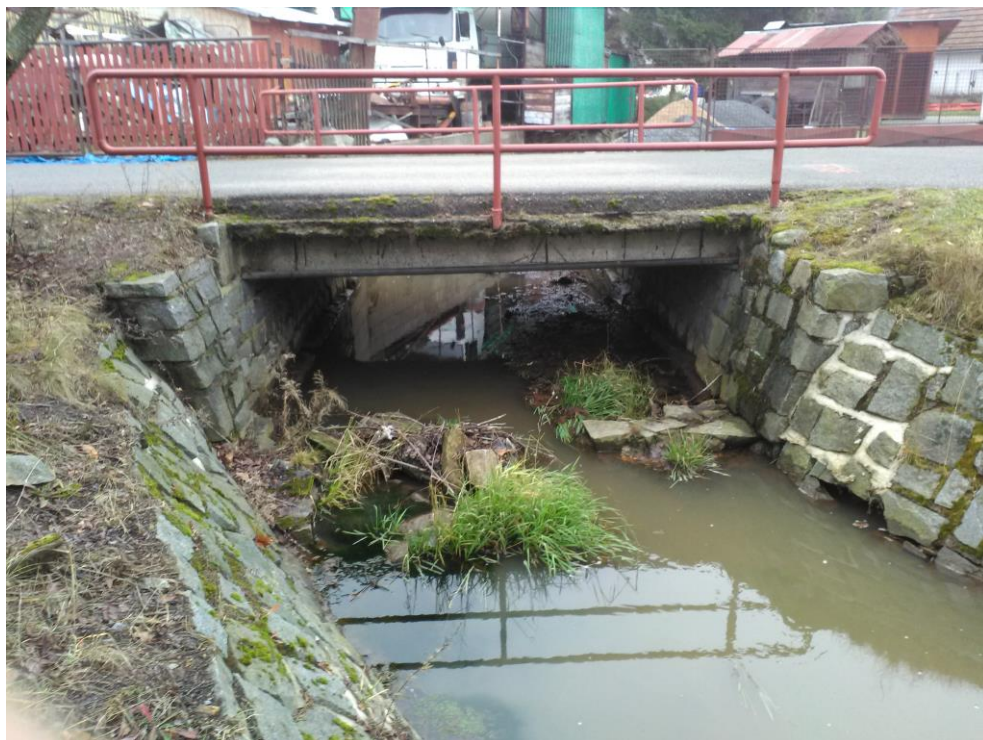
Obr. 1. – stávající nekapacitní mostek