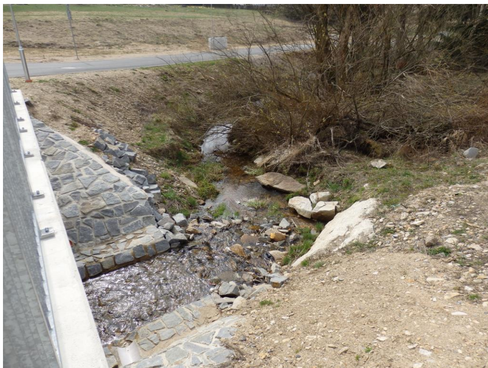
Obr. 18. – stávající stav koryta pod novým mostkem – pravoúhlé napojení na koryto (jiný pohled)