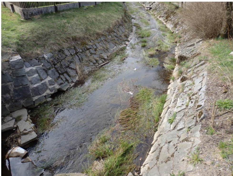
Obr. 3. – stávající koryto pod nekapacitním mostkem