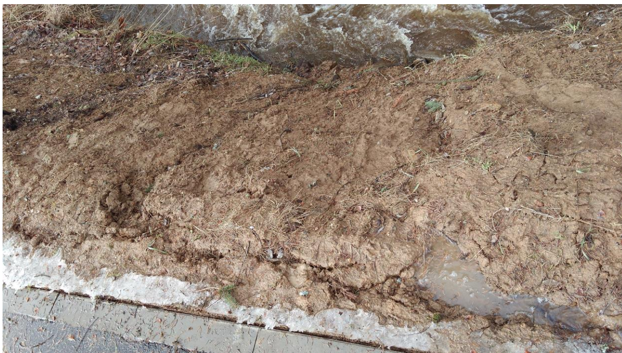
Obr. 14. – erozivní účinky toku na nově vytvořený svah