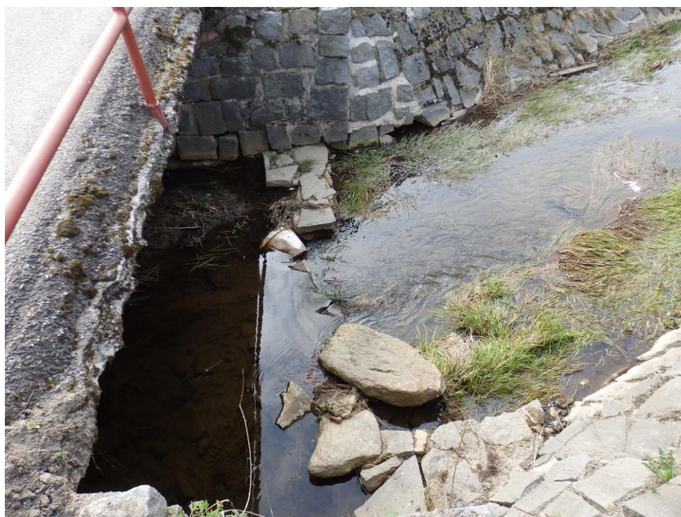
Obr. 2. – znečištění koryta pod nekapacitním mostkem