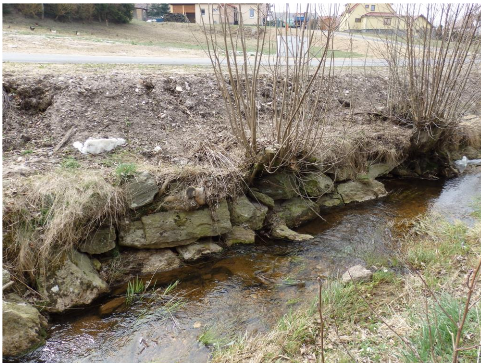
Obr. 15. – stávající občasné opevnění břehu toku