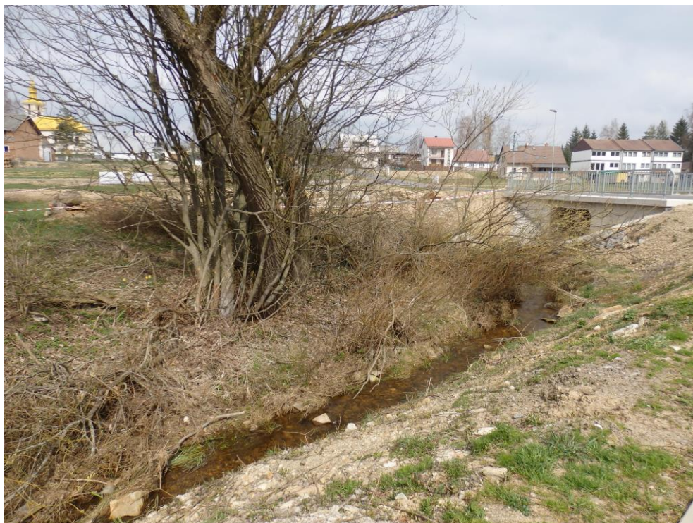
Obr. 19. – stávající stav koryta pod novým mostkem – místo pro rozšíření koryta