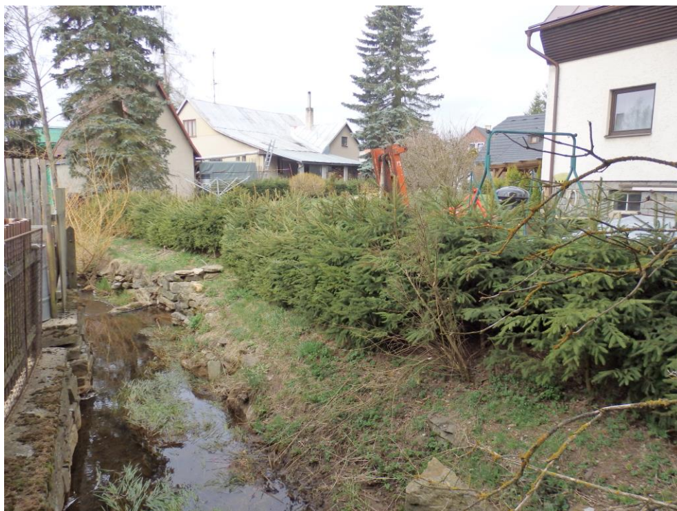
Obr. 6. – stávající koryto zúžené záborem pozemku – živý plot