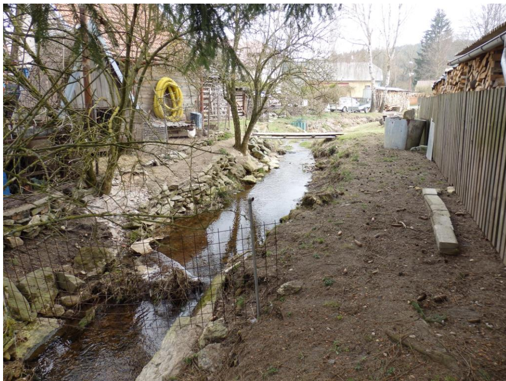
Obr. 7. – zúžené koryto toku se zaplacením koryta