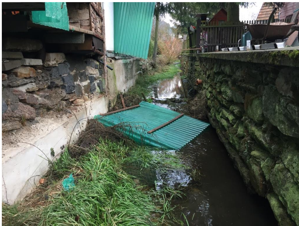
Obr. 5. – stávající koryto zúžené nelegálními stavbami