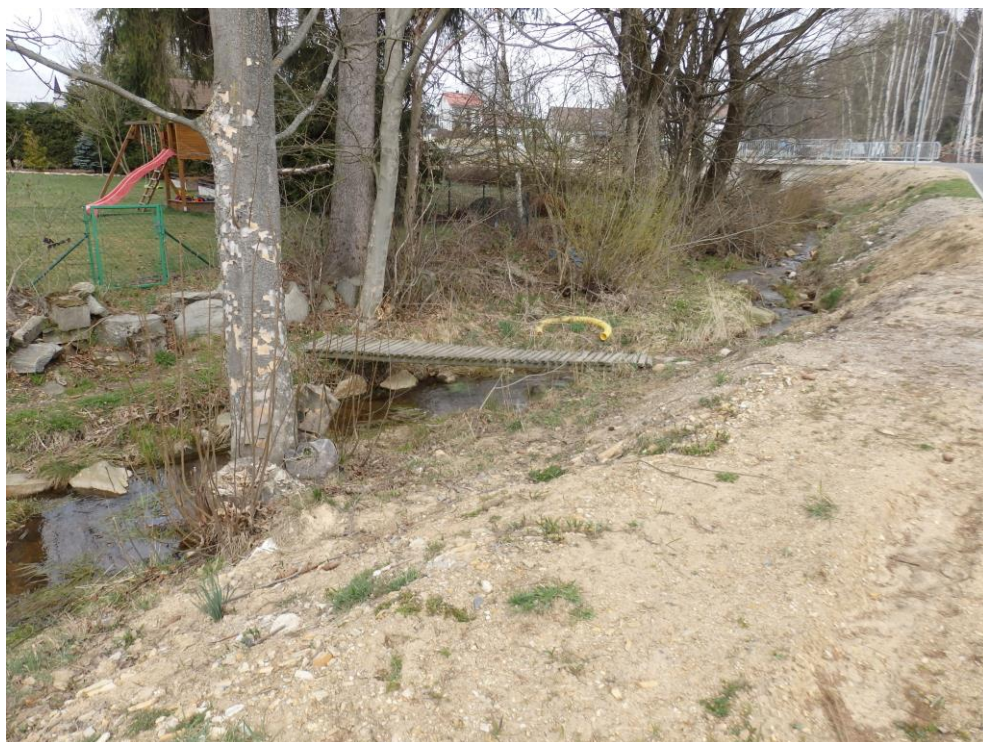
Obr. 12. – stávající stav koryta s nově navýšeným terénem s komunikací na levém břehu